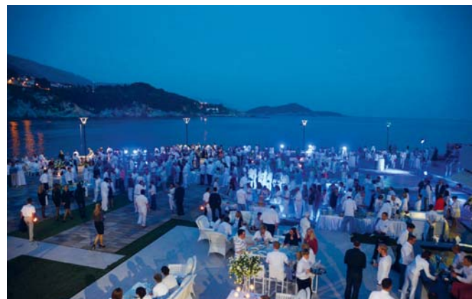
Schmetterling Jahrestagung, Kroatien

herzlich eingeladen. Jedes Jahr suchen wir dafür eine neue, exklusive Location. Wir würden uns freuen, Sie beim nächsten Mal dort begrüßen zu dürfen.