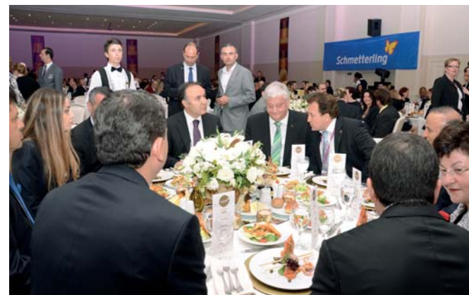
Schmetterling Jahrestagung, Türkei