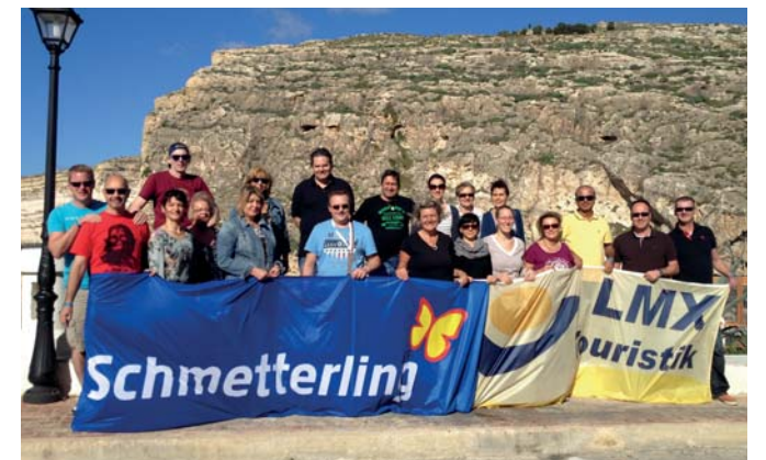
Schmetterling TOP-Partner-Treffen, Malta

Bei unserem vergangenen TOP-Partner-Treffen sorgten eine Powerbootfahrt und eine Jeep-Safari für viel Action. Fünf Hotelbesichtigungen, Stadtführungen und leckeres Essen ließen bei den Schmetterlingen keine Langeweile aufkommen.