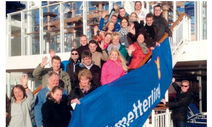
NCL Premierenkreuzfahrt auf der Norwegian Getaway im Mittelmeer