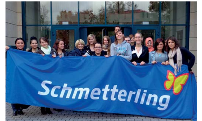
Ameropa Azubi Inforeise Frankfurt