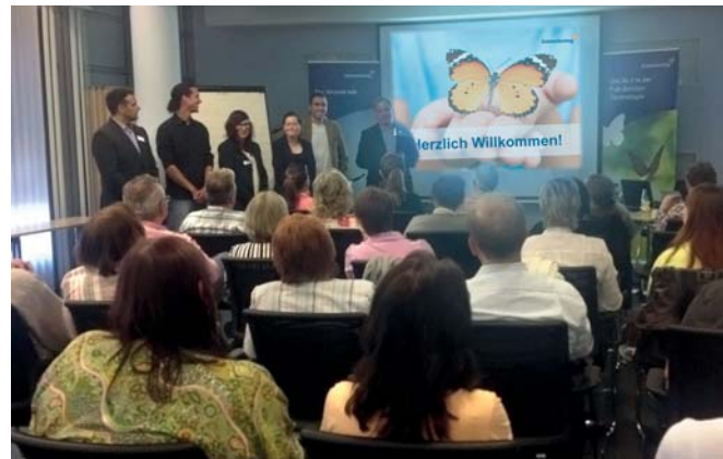
Schmetterling Dialogtag, Köln

Zusatzprodukte und Informationen erwarten unsere Partner. Unterstützt werden diese Abende von unseren Sortiments-Partnern. Nehmen Sie sich einige Stunden Zeit und investieren Sie diese in die wichtigen Faktoren Weiterbildung und Netzwerke – die Schmetterling Dialogtage geben Ihnen dazu beste Gelegenheit.