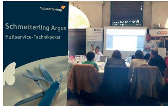
Schmetterling Dialogtag, Hamburg