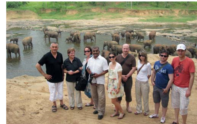
Mit FOX-Tours nach Sri Lanka