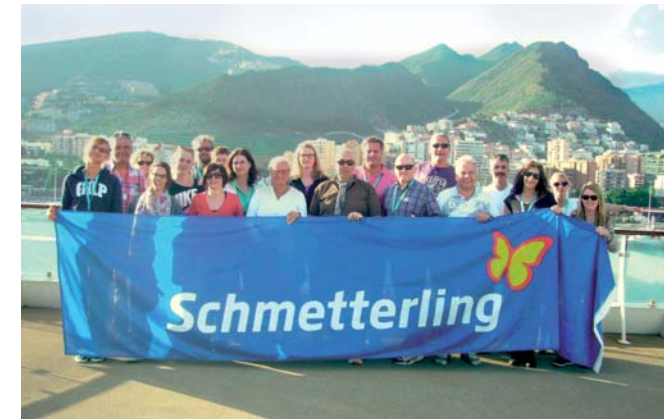
Schmetterling Seminarreise mit TUI Cruises Route: Gran Canaria – Lanzarote – Teneriffa – Agadir – Gran Canaria